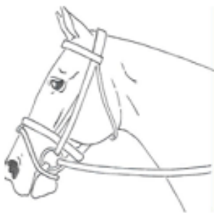
3) Podpínací hanoverský