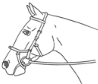
5) Ďalší typ (Miclemova uzda)