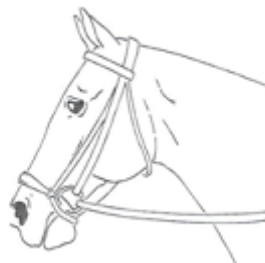
4) Obyčajný s podpnutím ( írsky )